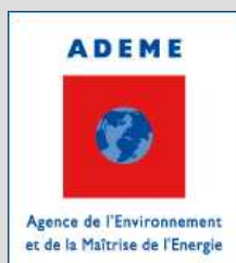
L'ADEME Agence De l'Environnement et de la Maîtrise de l'Énergie Délégation Provence-Alpes-Côte d'Azur