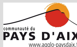
La Communauté du Pays d'Aix