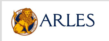
La Ville d'Arles